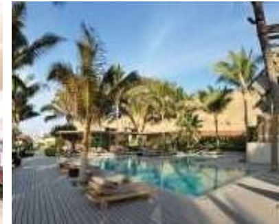
HOTEL, CASINOS Y RESTAURANTES