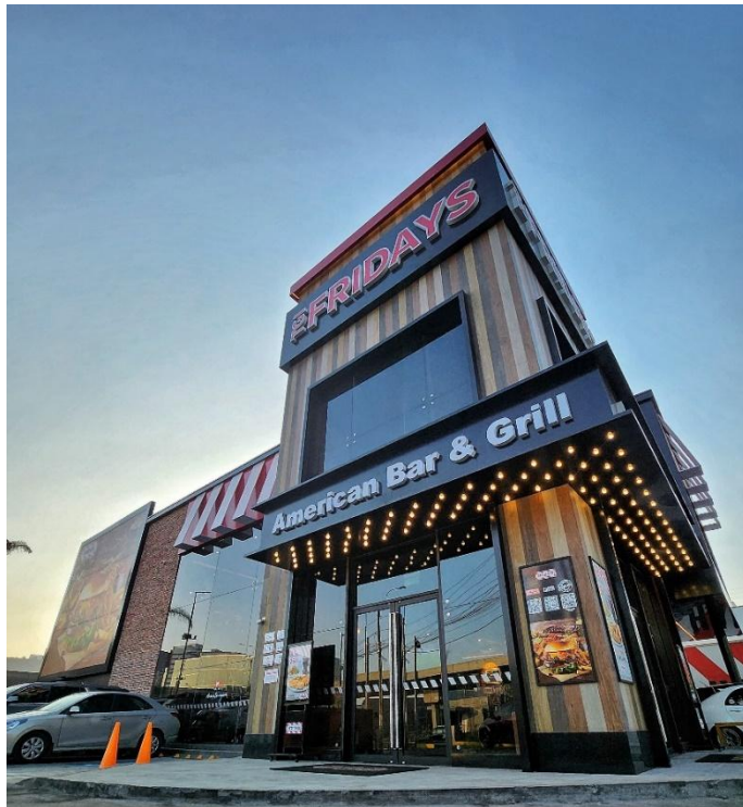
T.G.I. Friday's, Ovalo Monitor, Surco