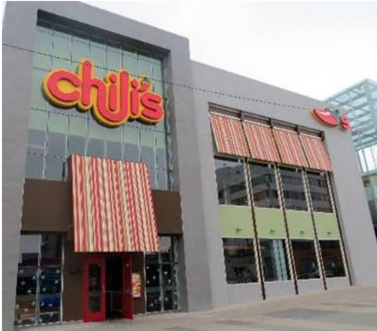
Chili's, Centro Comercial La Rambla, San Borja