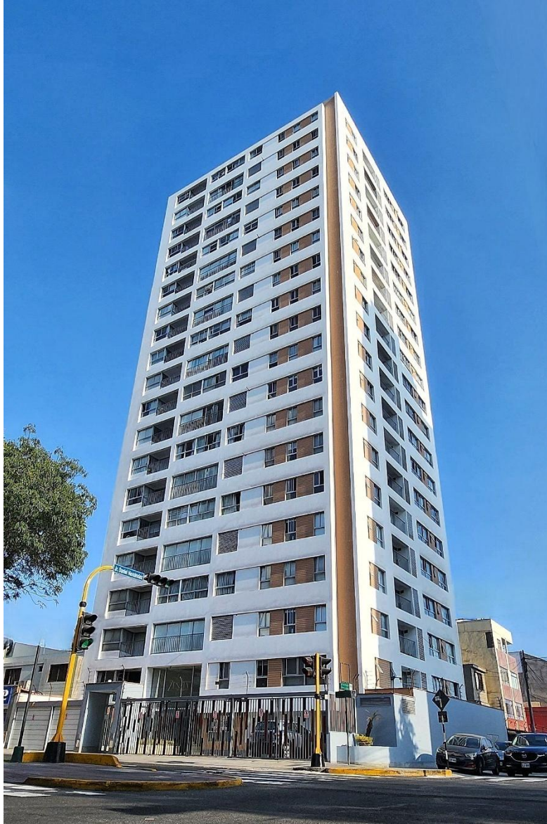
Edif. Multifamiliar Zentia, Pueblo Libre