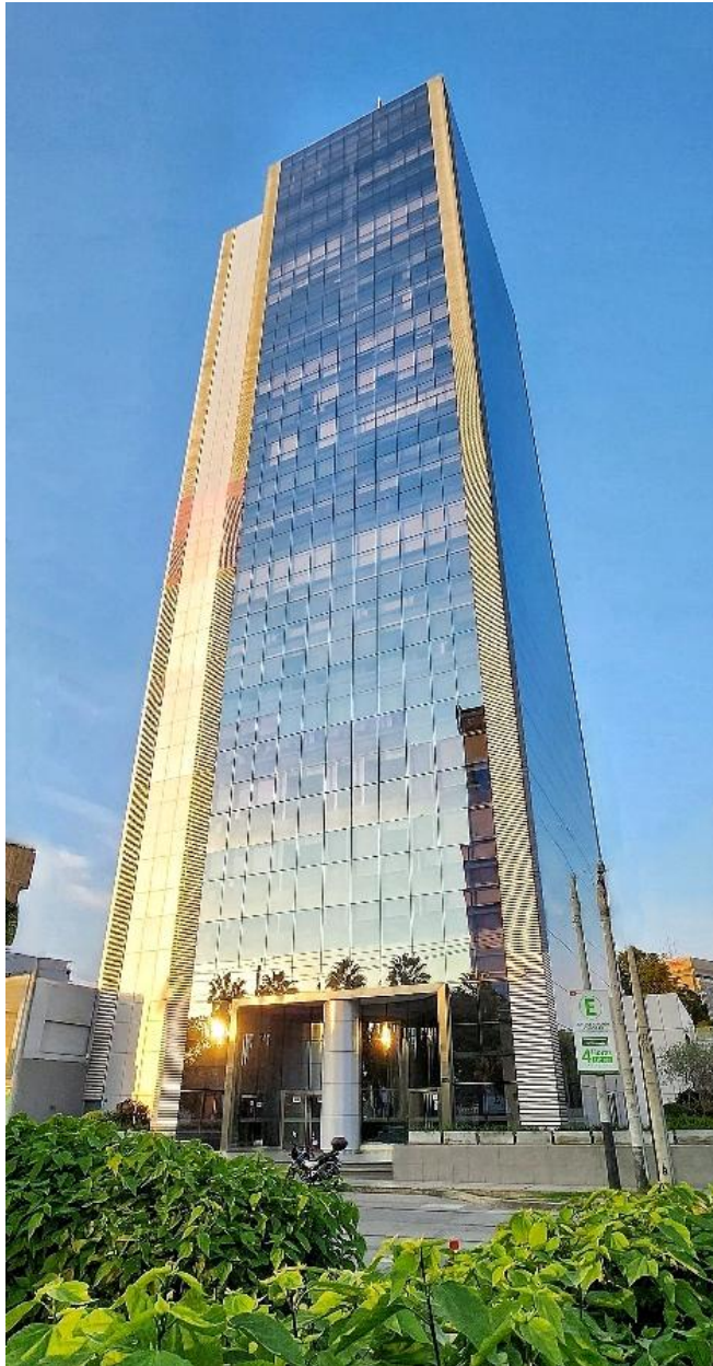
Edif. De Oficinas Trillium, San Isidro