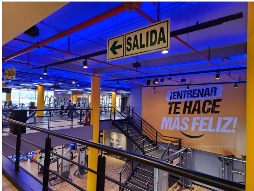
Gimnasio Smart Fit