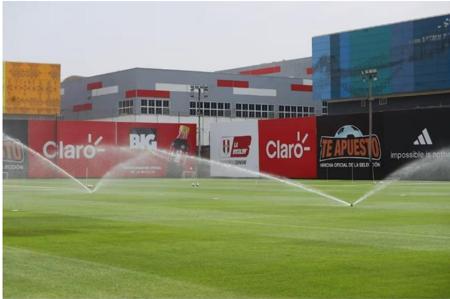
Federación Peruana de Fútbol, Videna, San Luis