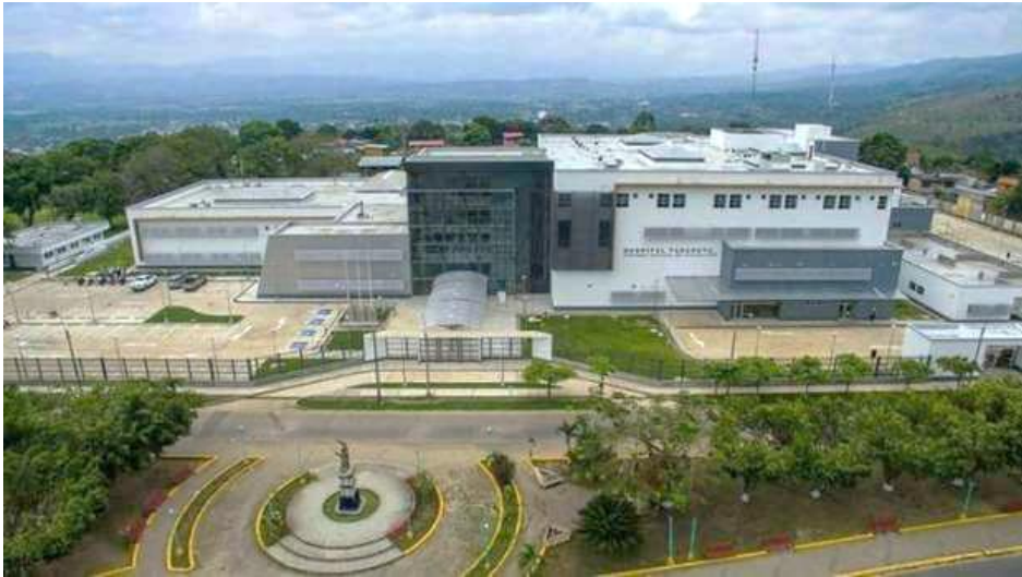
Hospital de Tarapoto