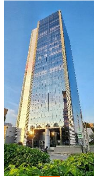
EDIFICIOS DE OFICINAS