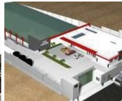
MINERIA E INDUSTRIA