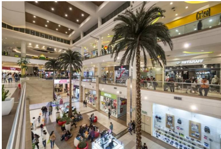
Nuevo Mall Aventura Iquitos