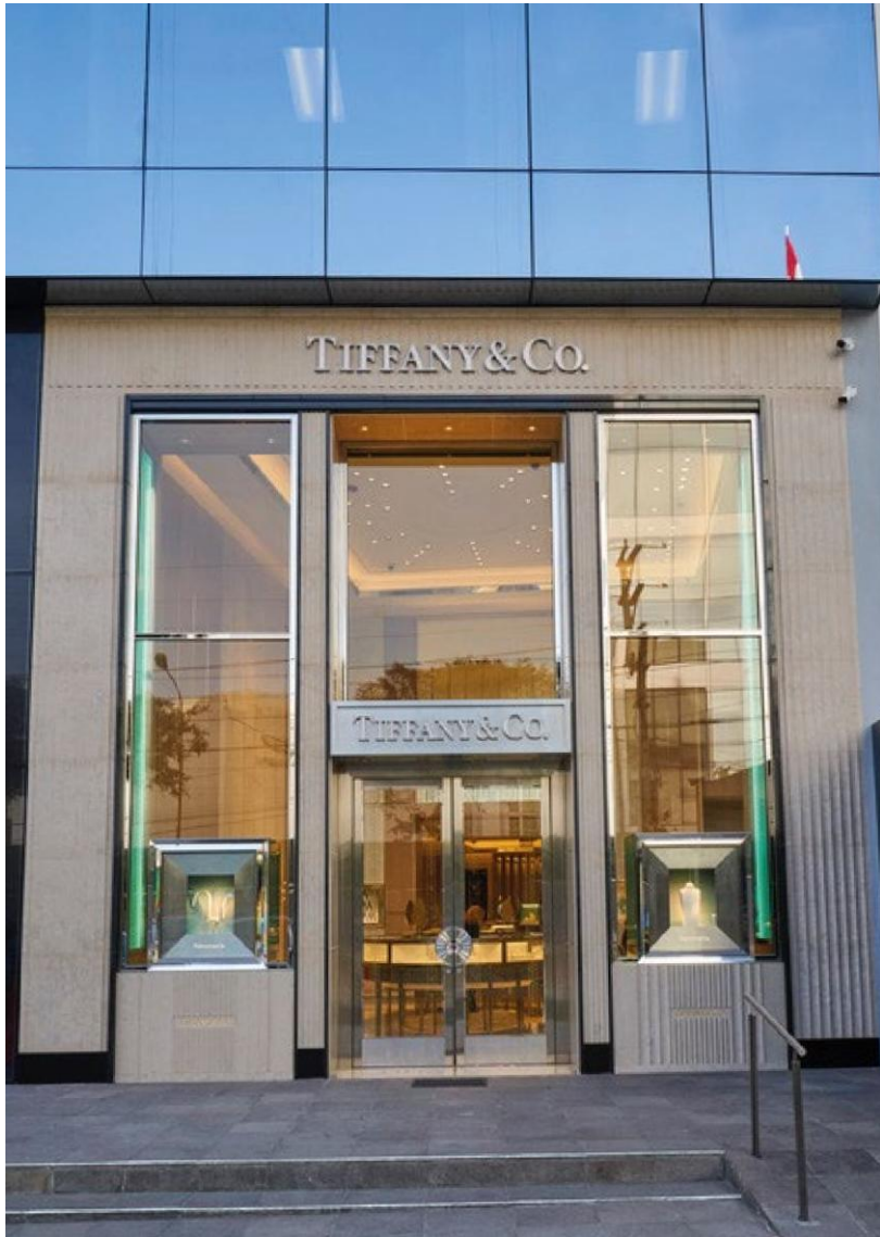
Tiffany & CO, Miraflores