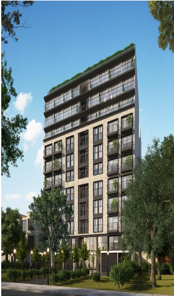
Edificio multifamiliar “Olive Park”