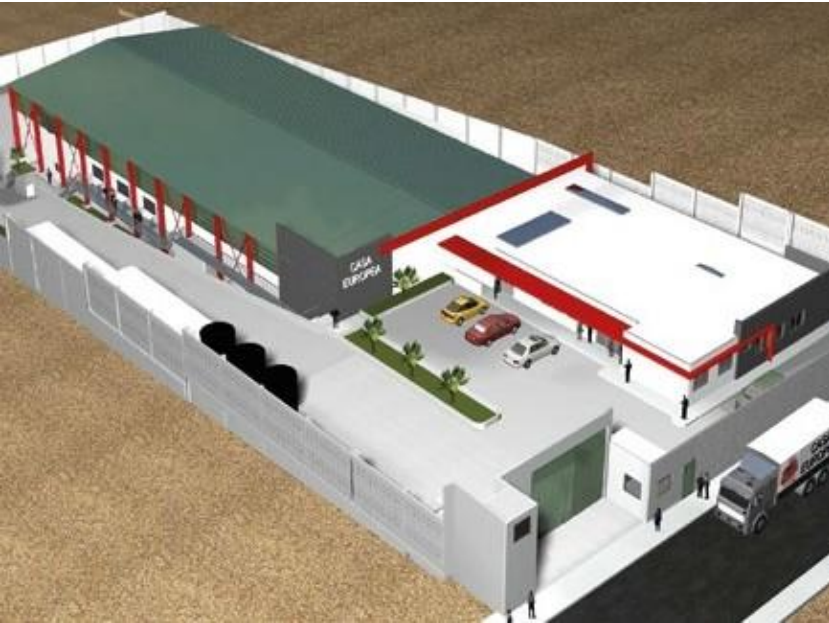
Planta Industrial Casa Europa, Villa El Salvador