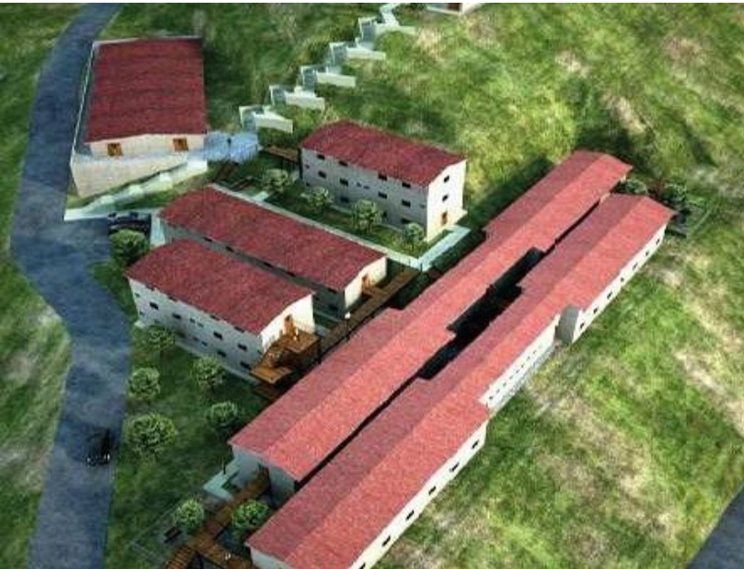
Campamento Las Lomas, Minera Milpo