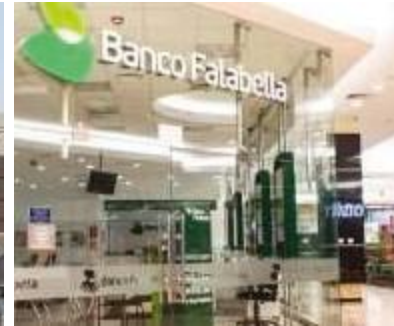
ENTIDADES BANCARIAS Y FINANCIERAS