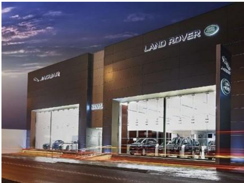
Land Rover, La Molina