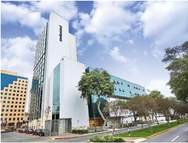
Hotel Swissotel, San Isidro