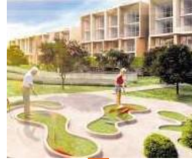
CONDOMINIOS Y RESIDENCIAS