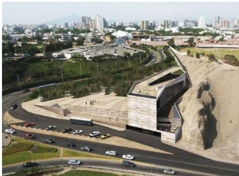
Lugar de la Memoria, Miraflores