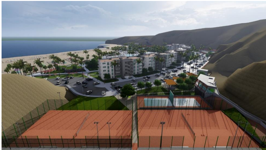
Nuevo Club Naval Ancón