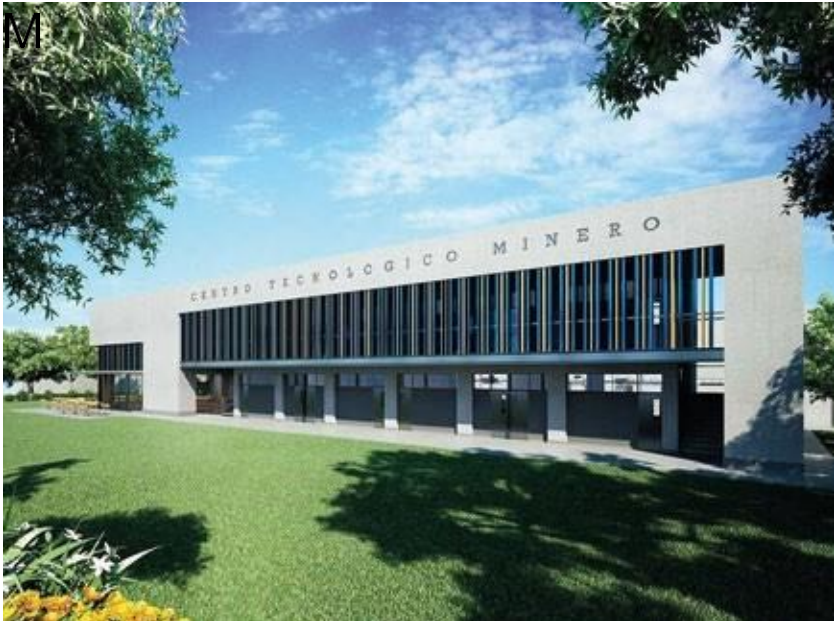
Centro Tecnológico Cetemin, Chosica